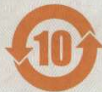
图2 标志 II